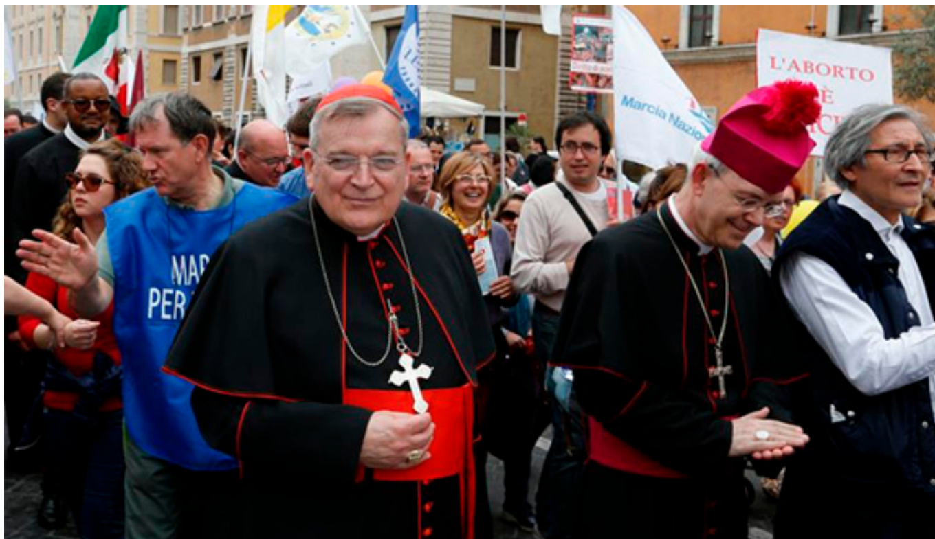
Cardeal Burke e Dom Athanasius Schneider na Marcha pela Vida, em Roma, 8 de maio de 2016.

Burke diretamente respondeu às afirmações feitas pelos colaboradores próximos do Papa, padre Antonio Spadaro e Cardeal Cristoph Schönborn, sobre Amoris Laetitia. Em particular, ele se referiu à declaração de Spadaro de que o Papa Francisco já respondeu ao dúvida dos quatro cardeais ao aprovar as diretrizes lançadas pelos bispos de Buenos Aires, que permitiram a Comunhão a divorciados recasados. Burke também respondeu à afirmação do Papa Francisco de que pessoas que são excessivamente “rígidas” quanto à defesa da doutrina sofrem de um tipo de “condição”.