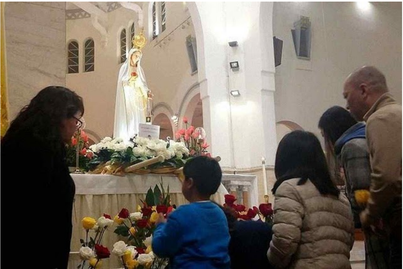
Católicos chineses veneram imagem peregrina de Nossa Senhora de Fátima em Hong-Kong

O culto a Maria Auxiliadora tem raízes muito antigas em toda a China como fonte de ajuda para as pessoas e, sobretudo, para a Igreja em geral.