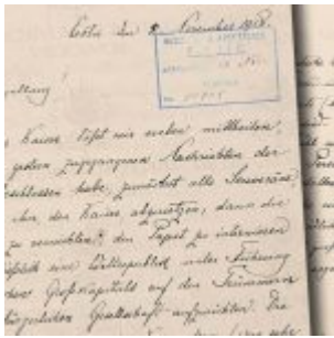
Imagem. Digitalização da carta original de três páginas dos Arquivos Secretos do Vaticano. Não temos autorização para publicar o conteúdo inteiro da carta, mas foi dada ao autor deste artigo a permissão para examiná-la na sua totalidade.